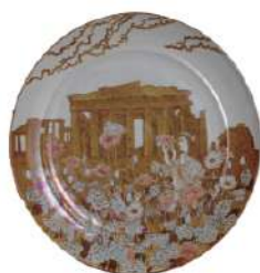
加藤卓男ラスター彩大皿