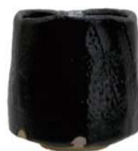
加藤孝造瀬戸黒茶碗