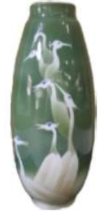
西浦焼西浦記念館蔵